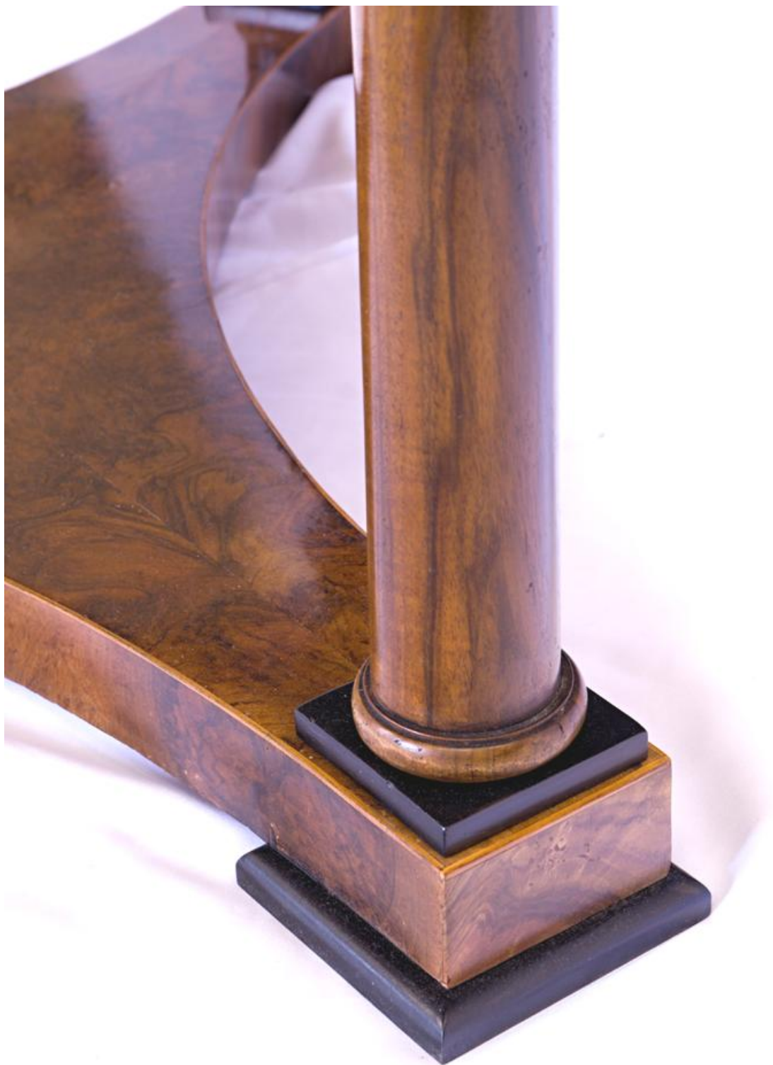
Obr. č. 37: Na snímku je zachycena spodní soklová část s nohou a s patkou sloupustav po restaurování zpatinování nových částí