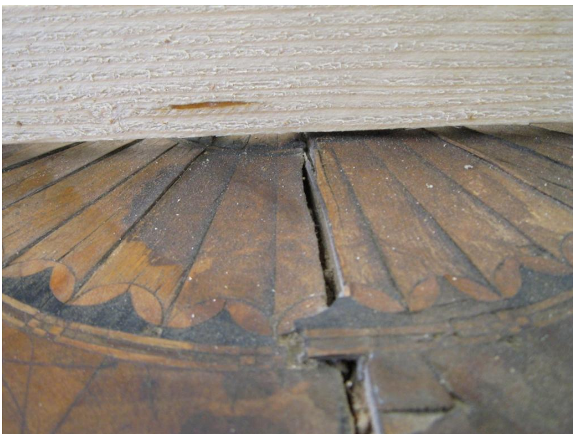
Obr. č. 14: Detailní snímek zachycuje míru zkroucení nosné desky v místě středové rozety.