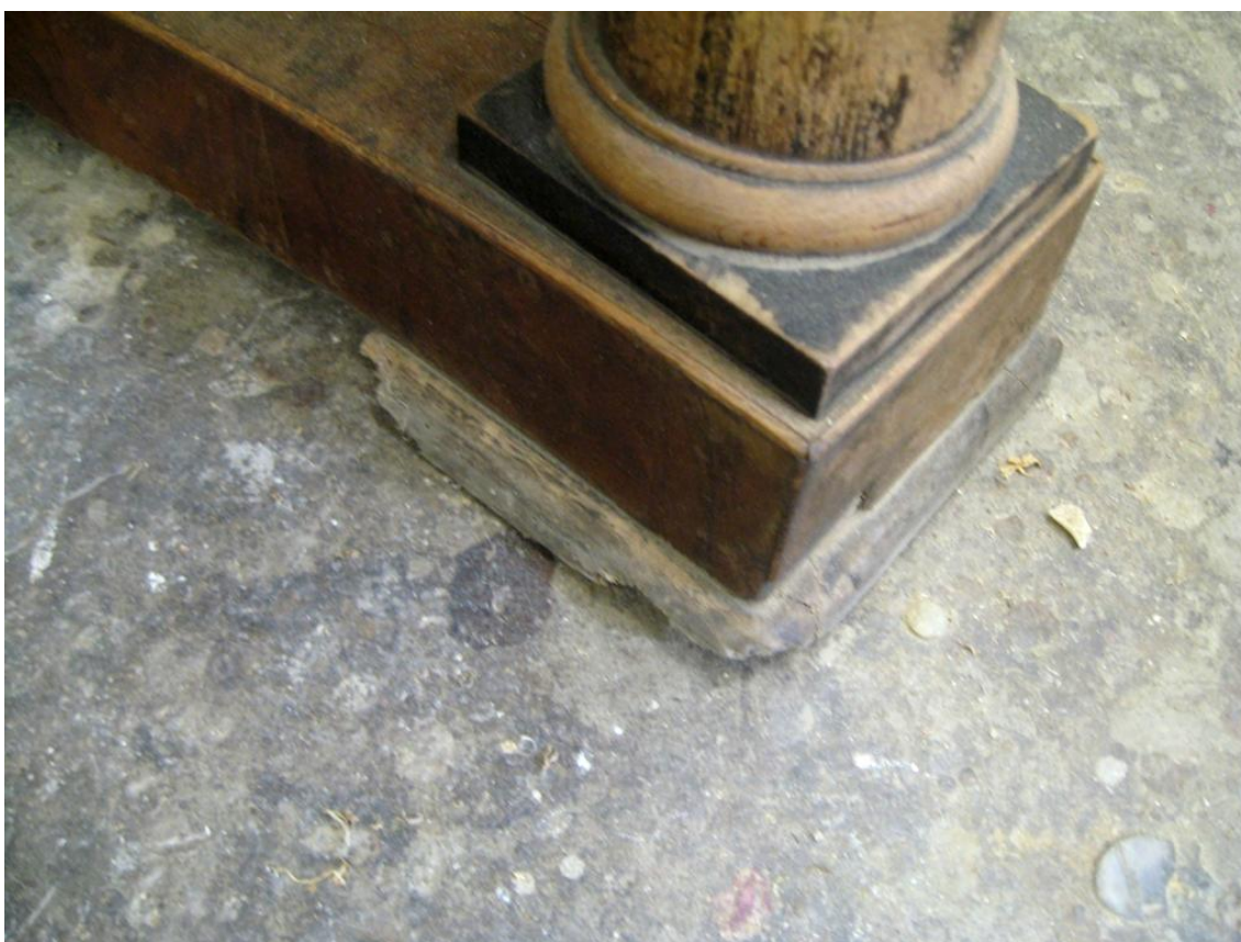
Obr. č. 16: Na snímku je zachycena architektura spodní soklová části.