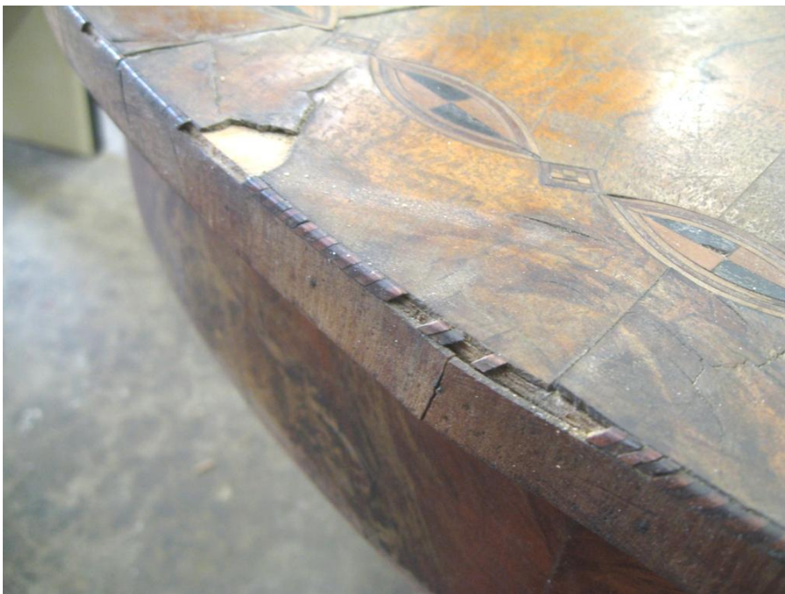
Obr. č. 11: Detailní snímek zachycuje zdobnou intarzovanou pásku na hraně desky včetně detailu poškození