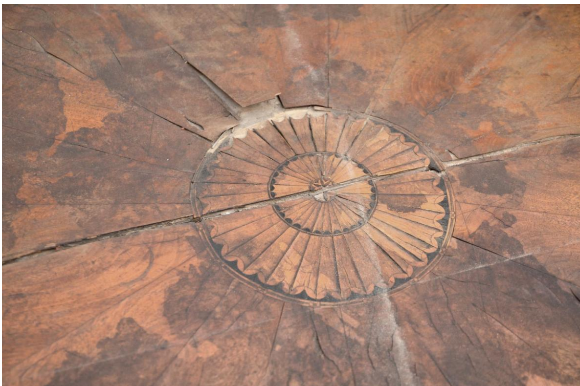
Obr. č. 6: Detailní snímek zachycuje centrální intarzovanou rozetu. Na snímku patrná masivní prasklina celé desky