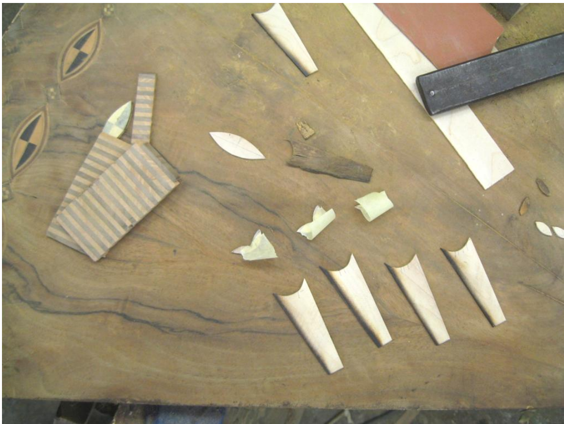
Obr. č. 27: Na snímku jsou zachyceny nové části rozety. Vlevo je zachycena metráž z, které bude následně šikmým řezem vyrobena linka na hraně desky