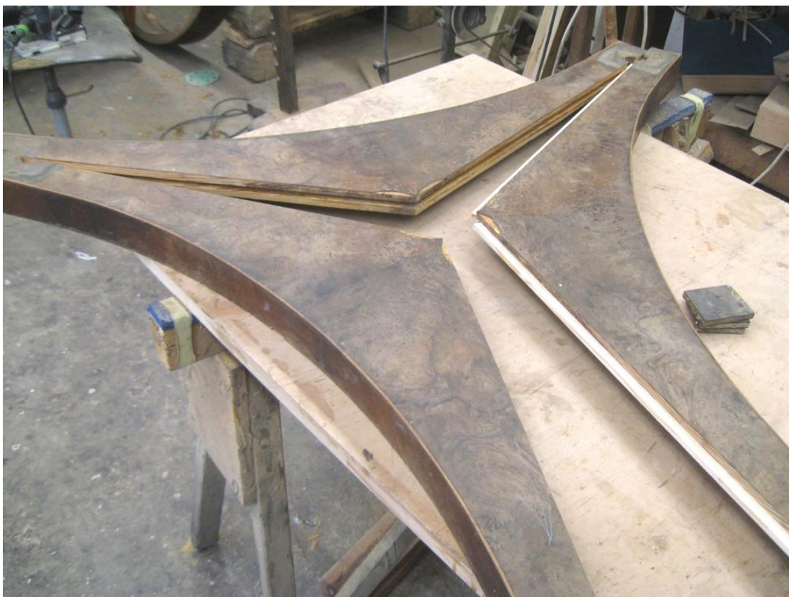
Obr. č. 19: Na snímku je zachycena spodní soklová část po dorovnání hran a po provedené zafrézování drážky a se vsazeným novým pérem.