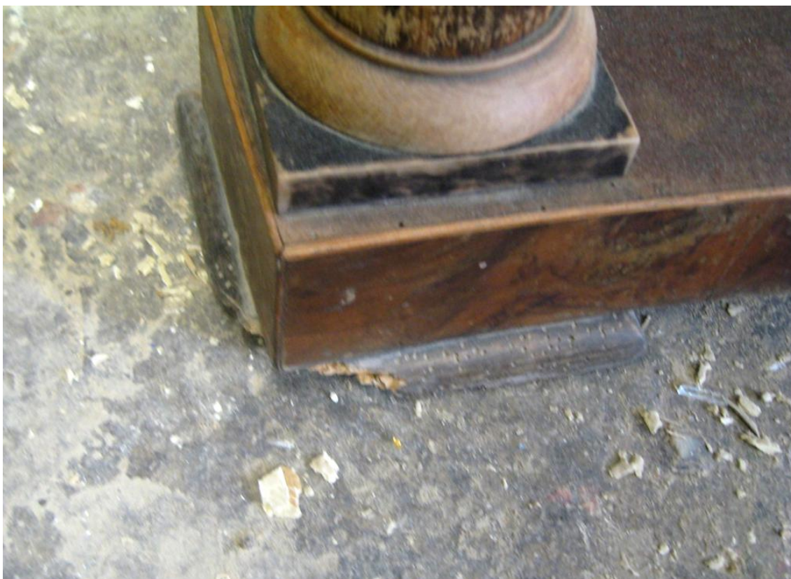
Obr. č. 15: Na snímku detail rozsahu poškození dřevěných destiček tvořících nohy.