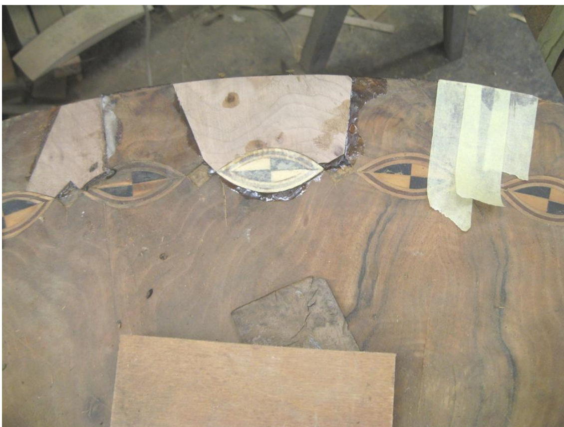
Obr. č. 30: Snímek zachycuje průběh oprav intarzií. Na snímku je patrné doplnění ořechové švartny. Doplněný vybraný materiál kresebně navazuje na původní kresbu. V lůžku je vlepený nový intarzovaný ornament.