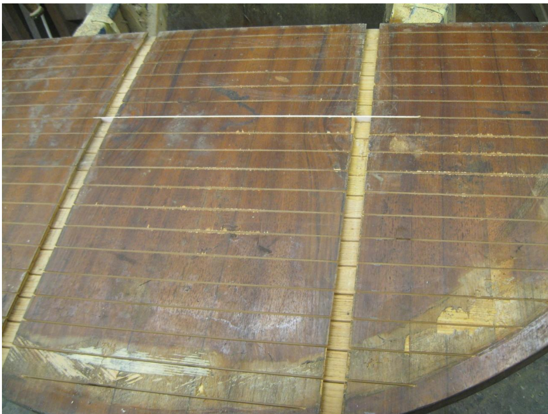
Obr. č. 18: Na snímku je zachyceno prořezání horní stolové desky ze spodní strany. Bez tohoto prořezání není možné desku následně vyrovnat.