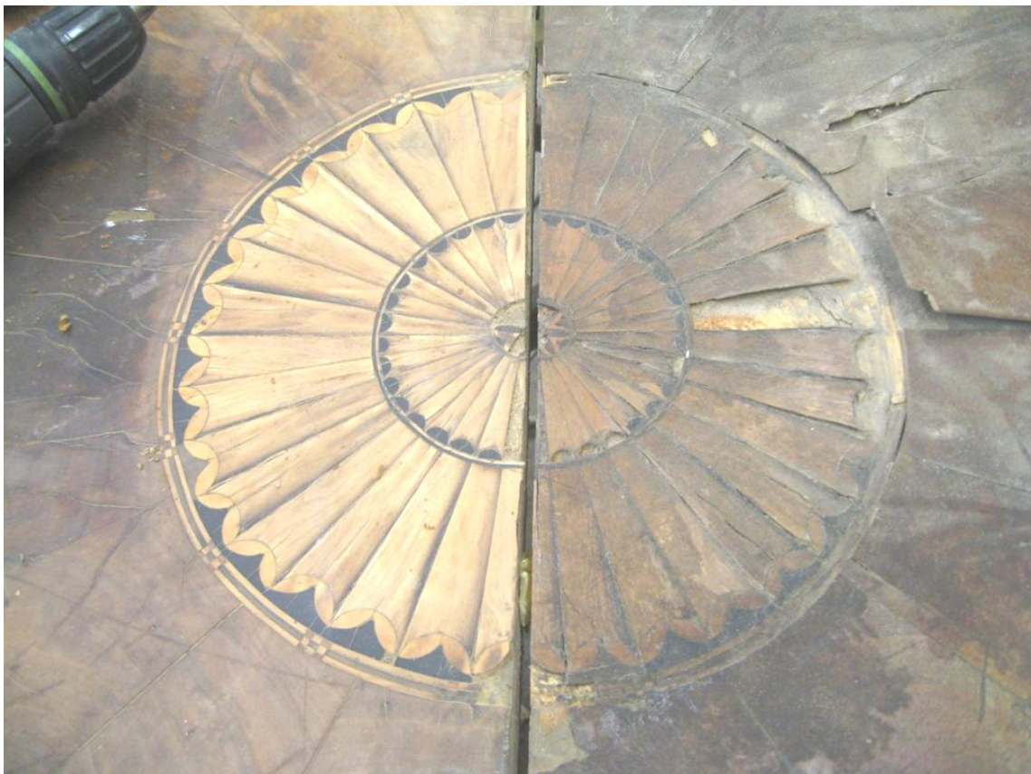
Obr. č. 26: Na snímku je zachycena levá část po provedeném podlepení a prvním přebroušení. Vpravo je polovina rozety před restaurováním.