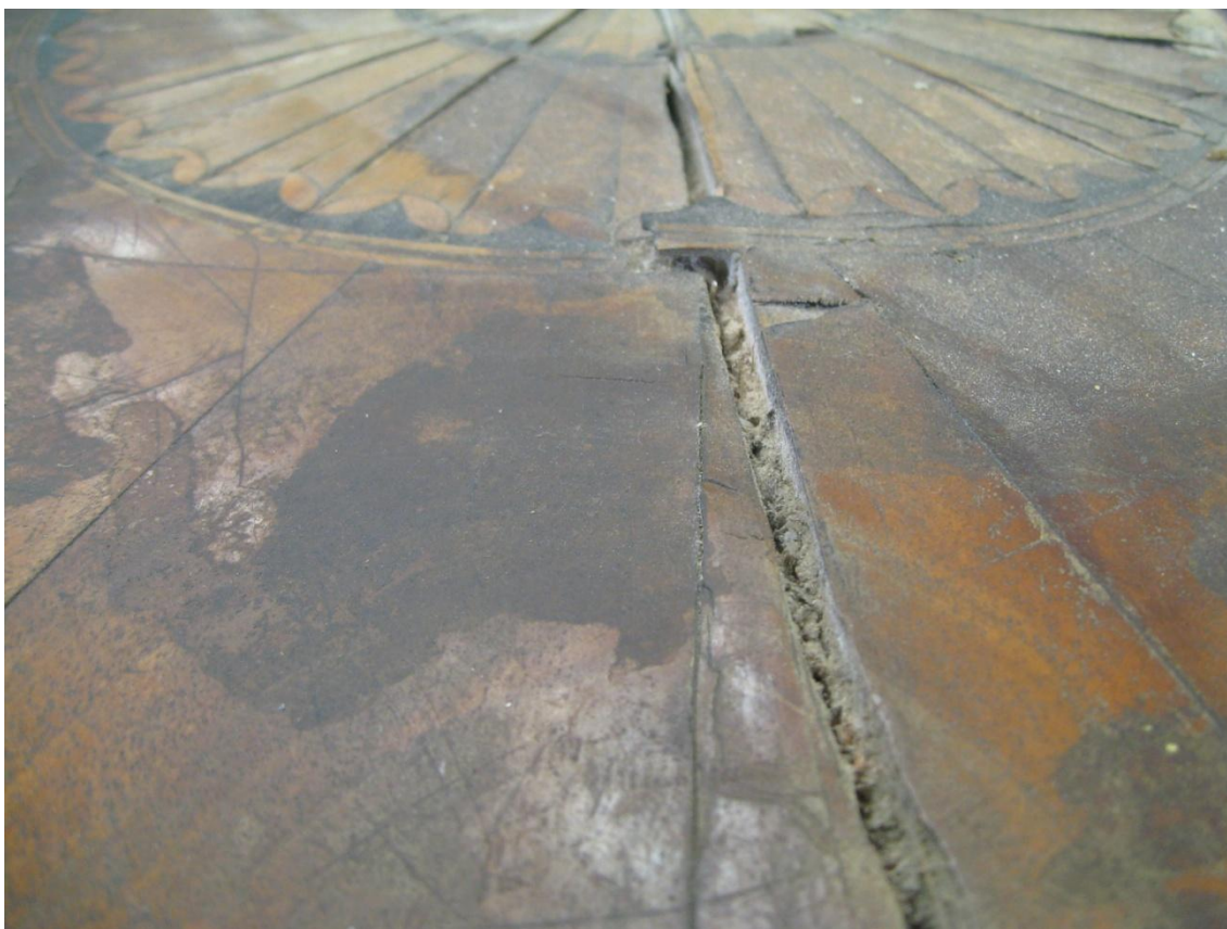
Obr. č. 9: Detailní snímek zachycuje masivní prasklinu ve středové části.