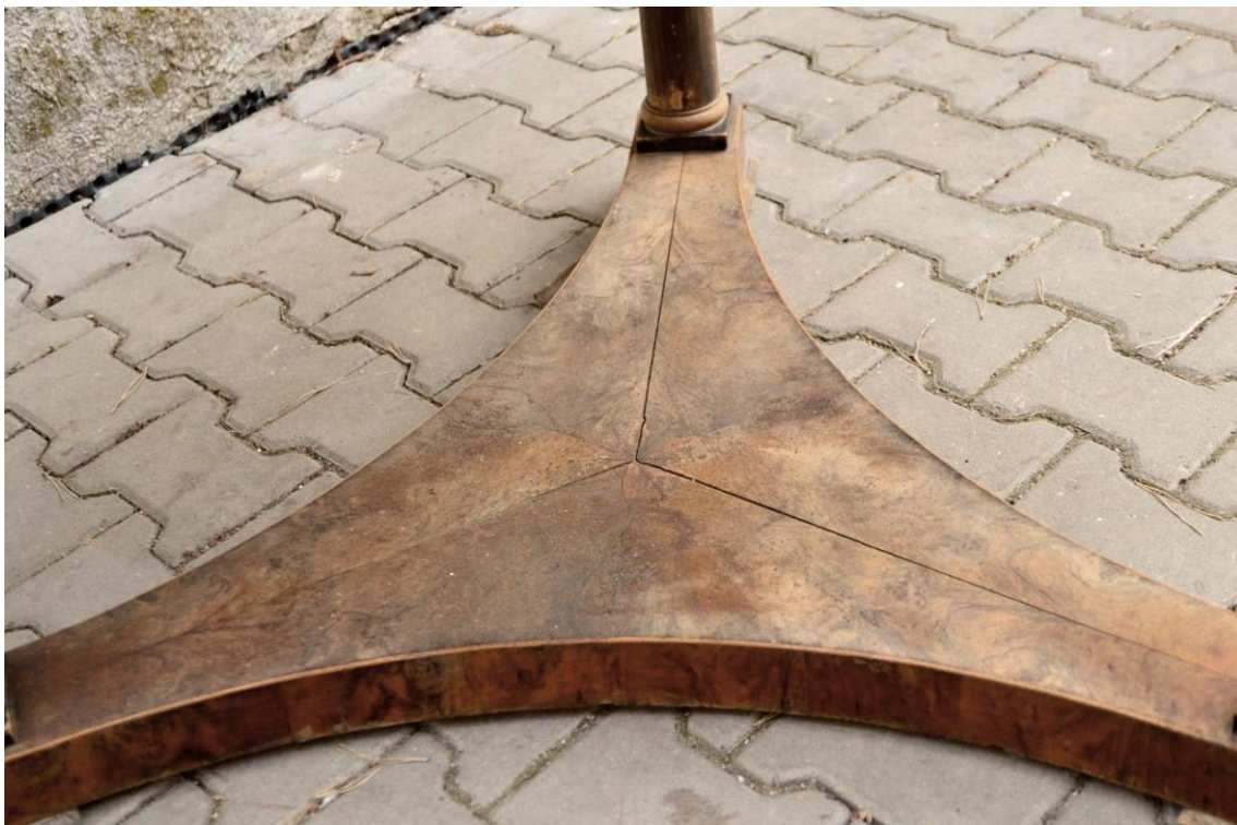
Obr. č. 3: Detailní snímek spodní trojcípé soklové části. Na snímku je patrné rozpraskání ve středu každého z cípů