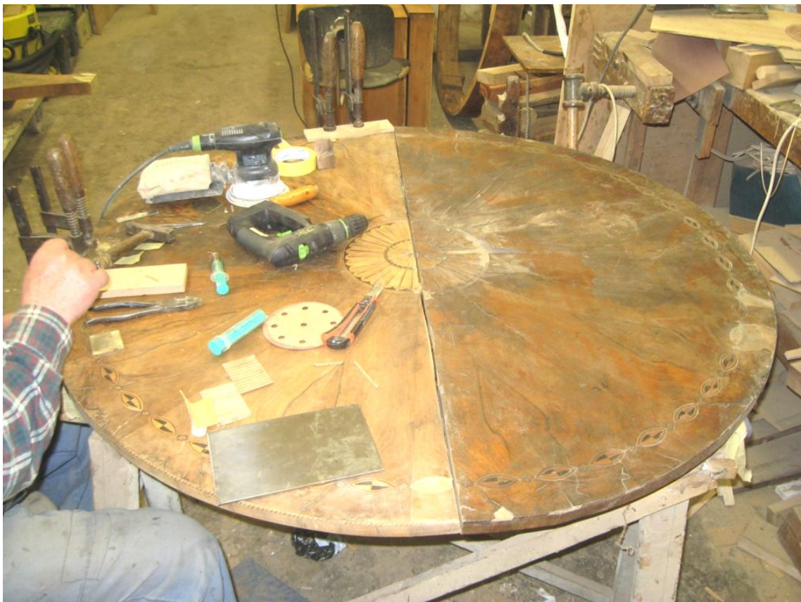
Obr. č. 25: Průběh restaurování horní stolové desky. Na snímku je zachyceno doplňování krajového ornamentu. Dole na desce je položen plech pro lepení.