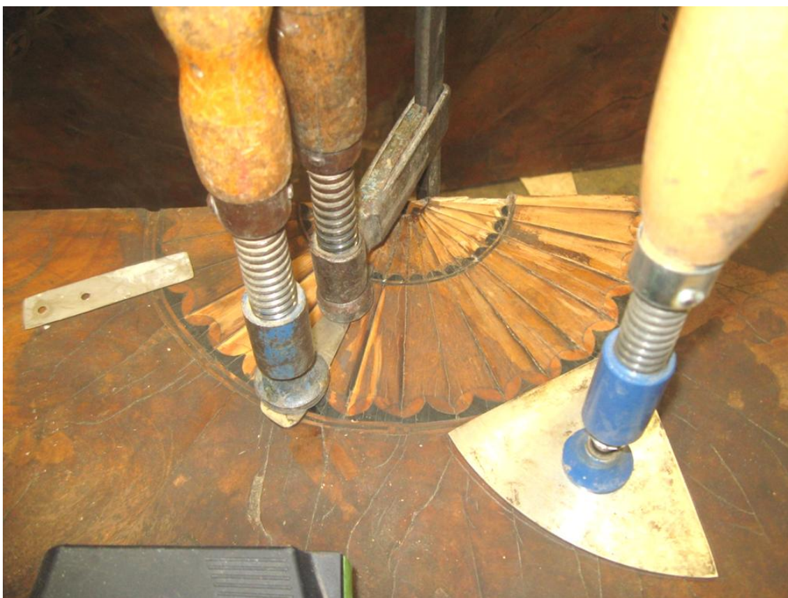
Obr. č. 24: Na snímku průběh restaurování rozety.