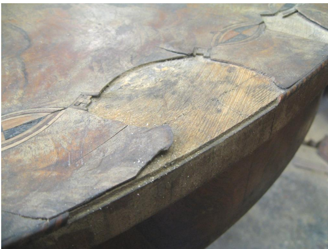
Obr. č. 12: Snímek zachycuje vypadlý ornament, odlomenou část ořechové dýhy na ploše včetně vypadlé zdobné pásky na hraně.