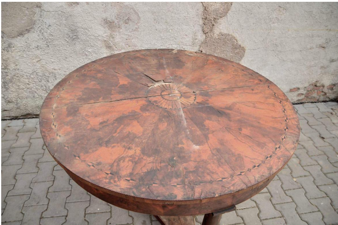
Obr. č. 5: Celkový pohled na horní stolovou desku . Na snímku je zachyceno zdobení horní desky a poškození ořechové dýhy způsobené dlouhodobým zatékáním vody