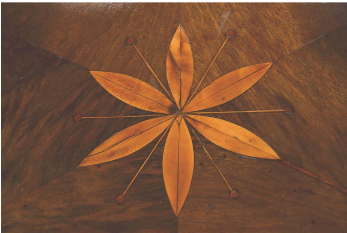
Obr. č. 38: Na detailním snímku je zachycena centrální florální intarzie na spodní soklové části – stav po restaurování