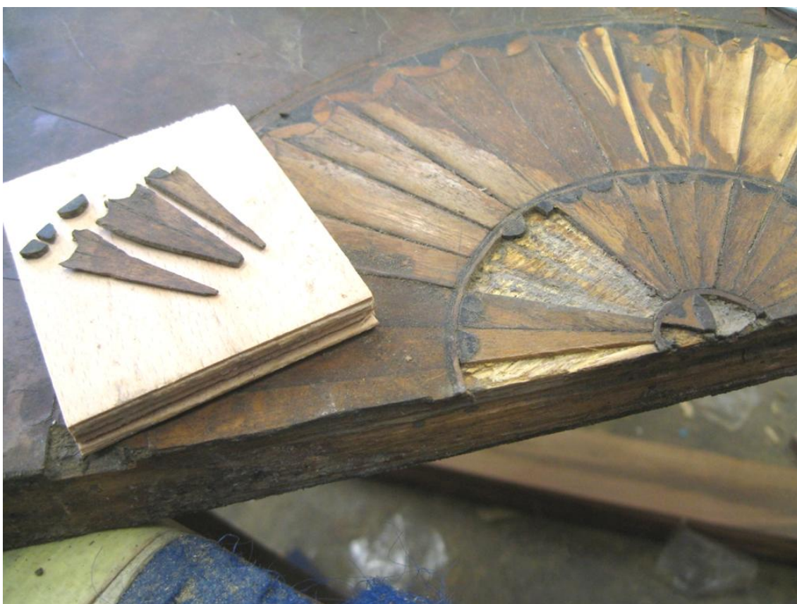
Obr. č. 22: Snímek zachycuje průběh restaurování středové rozety. Vlevo je možné pozorovat původní uvolněné části intarzie připravené na zalepení