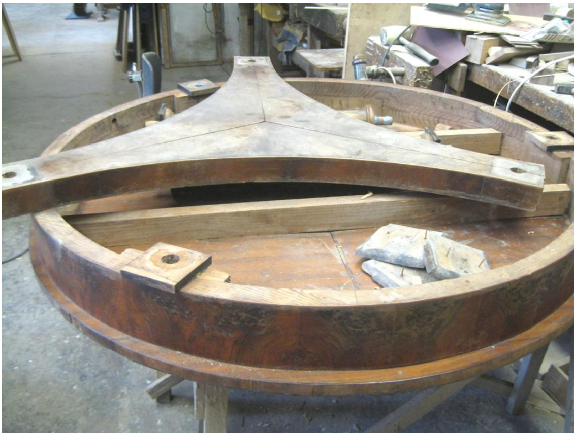
Obr. č. 17: Celkový pohled na stůl po demontáži