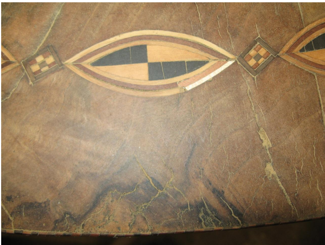
Obr. č. 31: Detailní pohled na doplněný a podlepený ornament po přebroušení