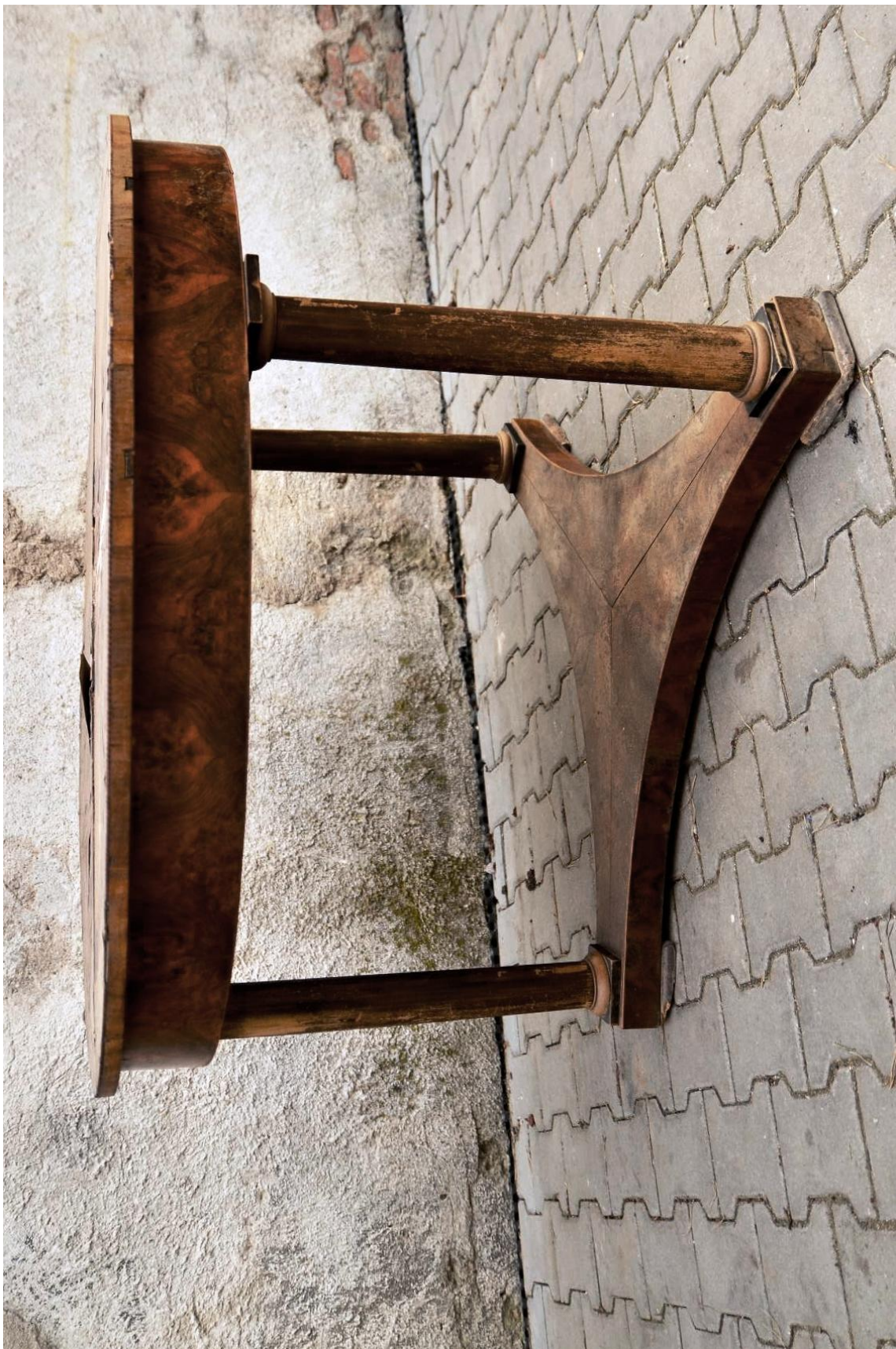
Obr. č. 2: Celkový pohled na stůl - stav před restaurováním. Na snímku jsou patrné druhotně doplněné sloupky s poškozeným fládrováním sloupků