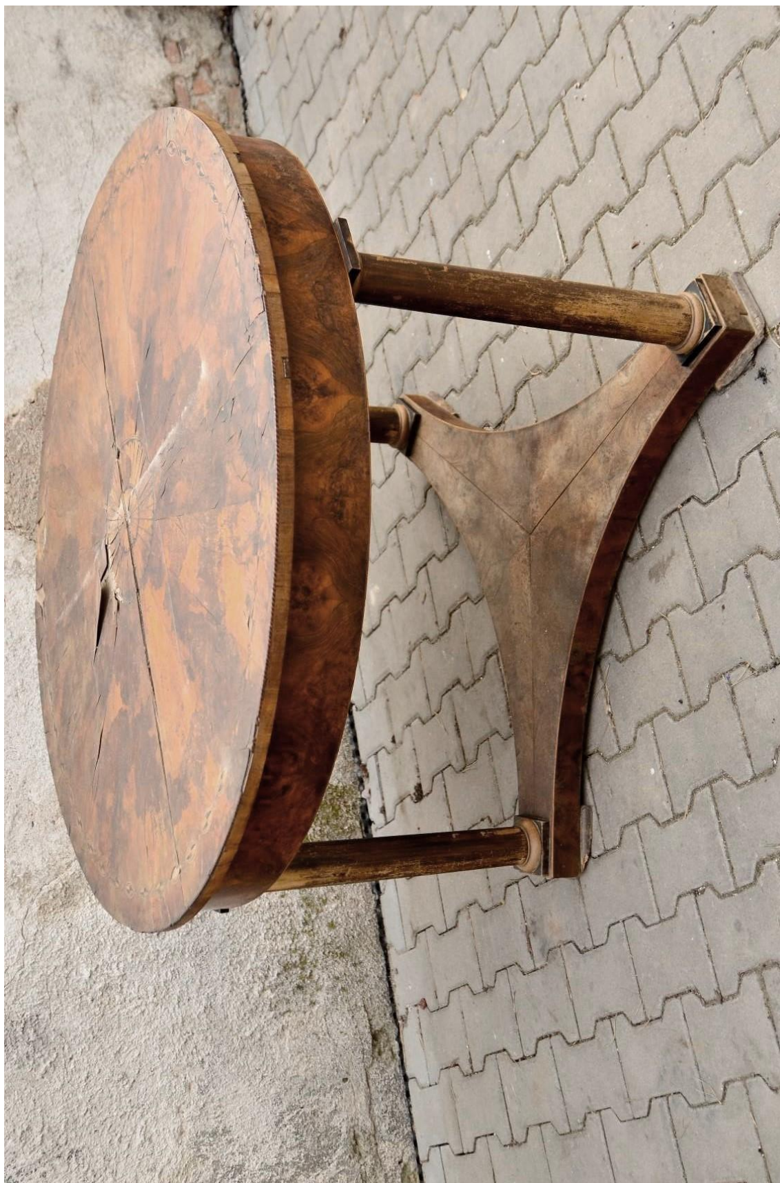
Obr. č. 1: Celkový pohled na stůl před restaurováním – na snímku je patrné poškození horní deska