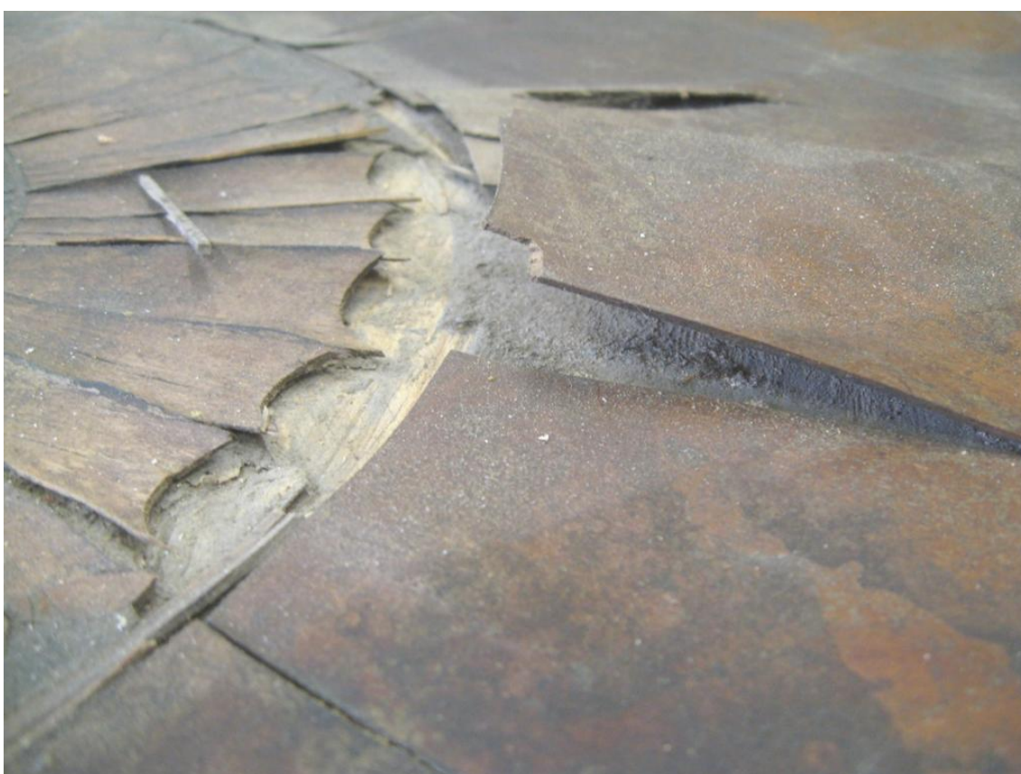
Obr. č. 8: Na detailním snímku je zachyceno poškození dýhovaných v oblasti centrální rozety