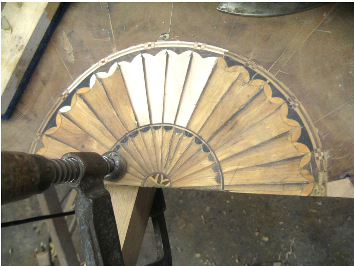
Obr. č. 28: Na snímku je zachycena středová rozeta s doplněnými novými díly. Na nových částech je možné vidět připalování nových částí.