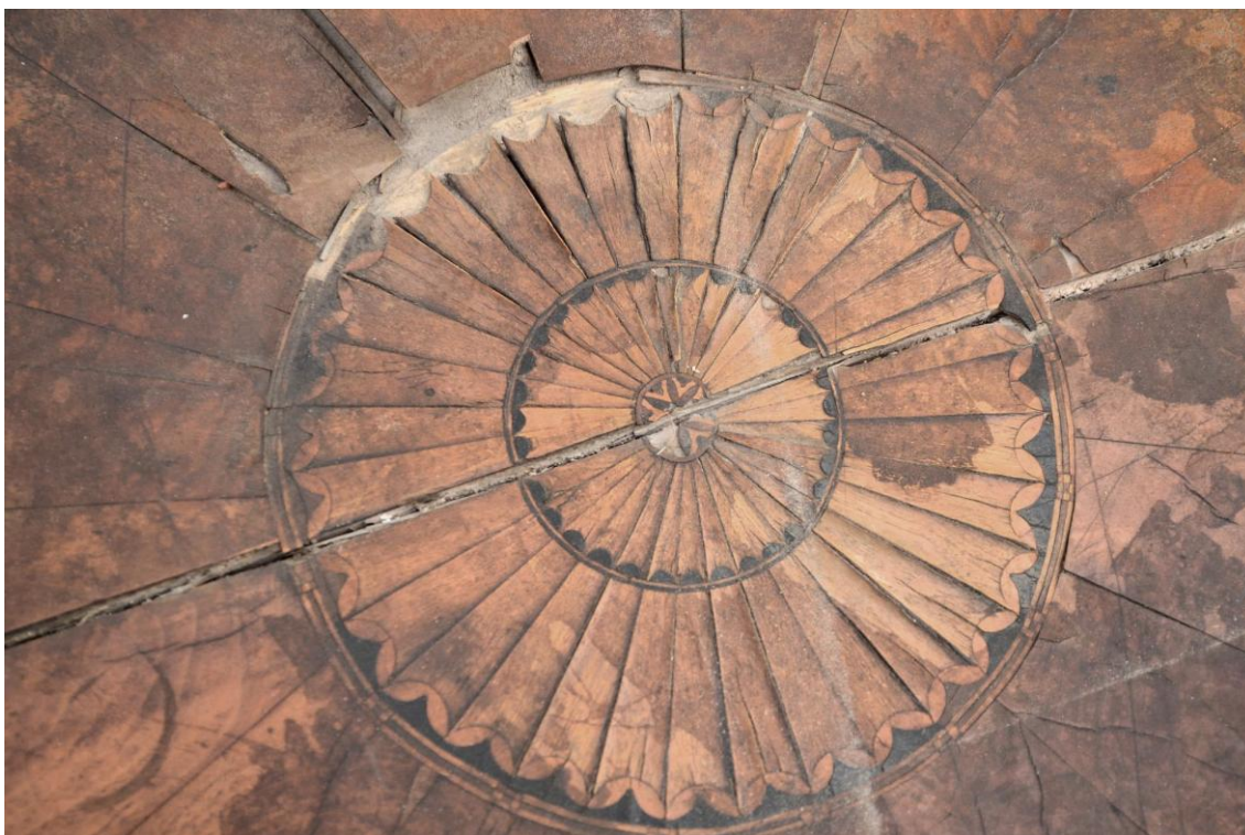
Obr. č. 7: Celkový snímek zachycující rozetu včetně poškození dýhovaných ploch a pohled na prasklinu procházející rozetou.