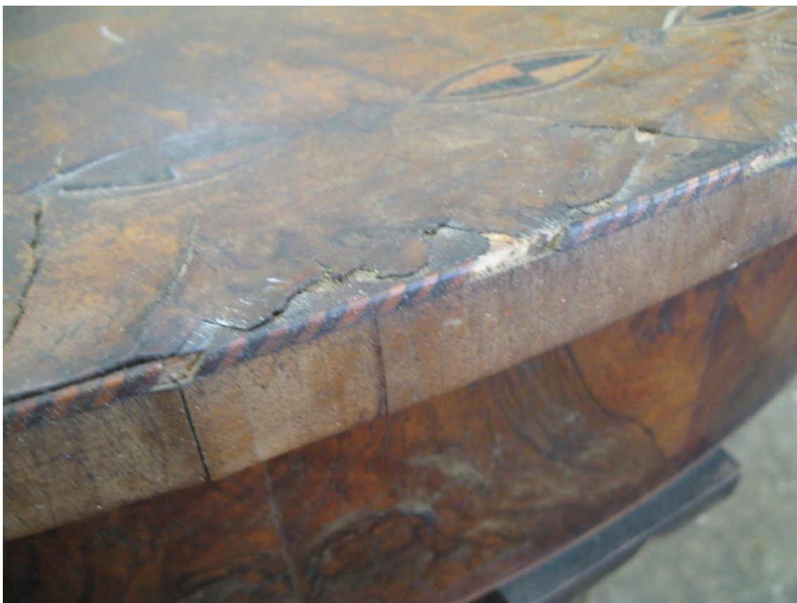
Obr. č. 13: Na snímku je zachycena poškozená dýhy na hraně desky.