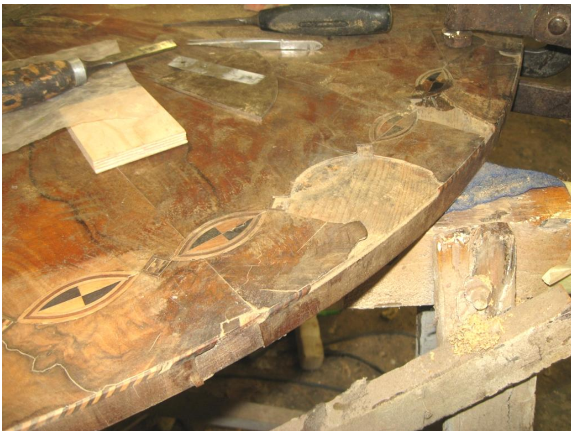
Obr. č. 29: Detailní snímek zachycuje průběh oprav intarzování. Na snímku je podlepená původní švartna a jsou zde vidět vyčištěná lůžka pro doplnění novou dýhou.