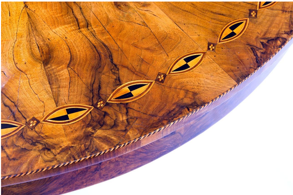
Obr. č. 34: Na snímku je intarzovaný geometrický ornament a zdobná pásková intarzie – stav po restaurování.