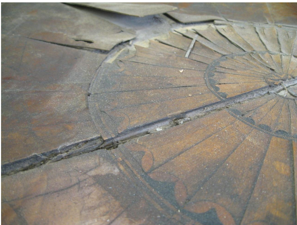
Obr. č. 10: Detailní snímek zachycuje prasklinu včetně odlepených dřív a částí intarzovaného ornamentu.