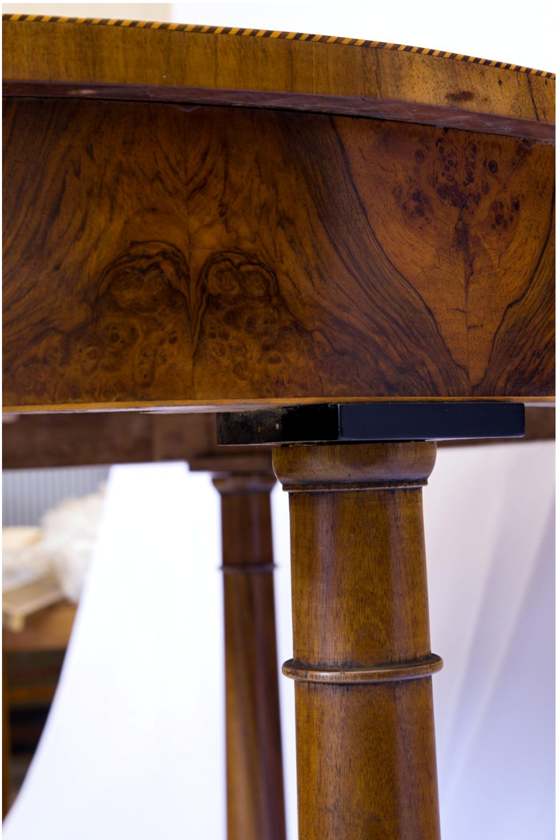
Obr. č. 36: Detail zachycuje zrestaurovaný lub stolu a nově vyrobený sloupek . Na snímku je sloupek se šelakovou politurou a po zapatinování.