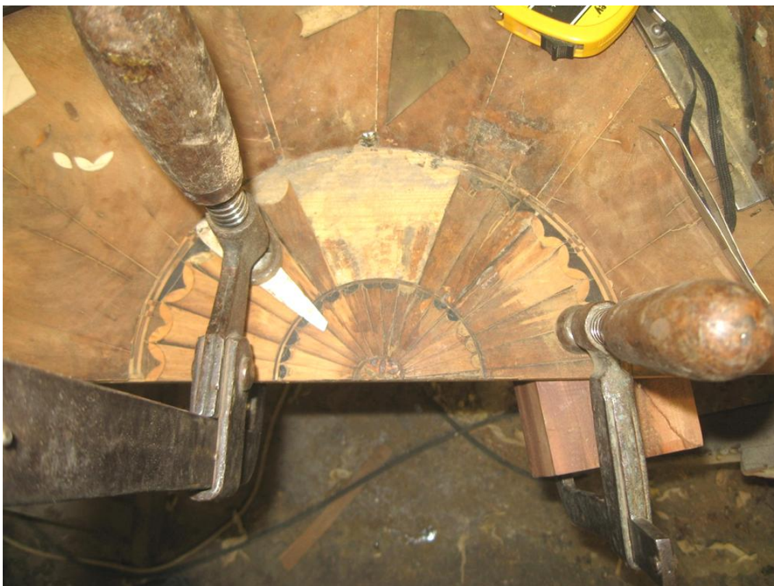
Obr. č. 23: Na snímku průběh restaurování rozety. Na snímku jsou zachycena vyčištěná lůžka pro doplnění novými částmi intarzie.