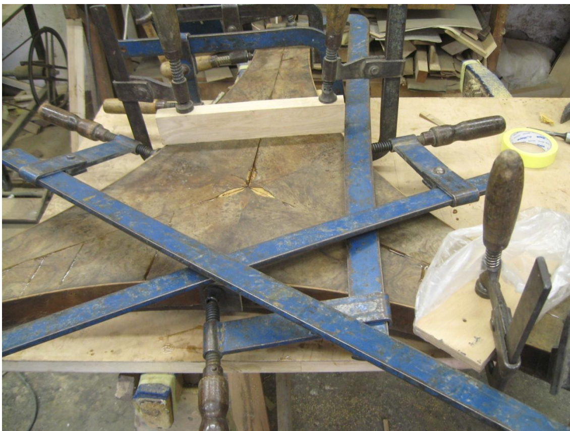
Obr. č. 20: Průběh restaurování -Snímek zachycuje následné lepení spodní soklové části.