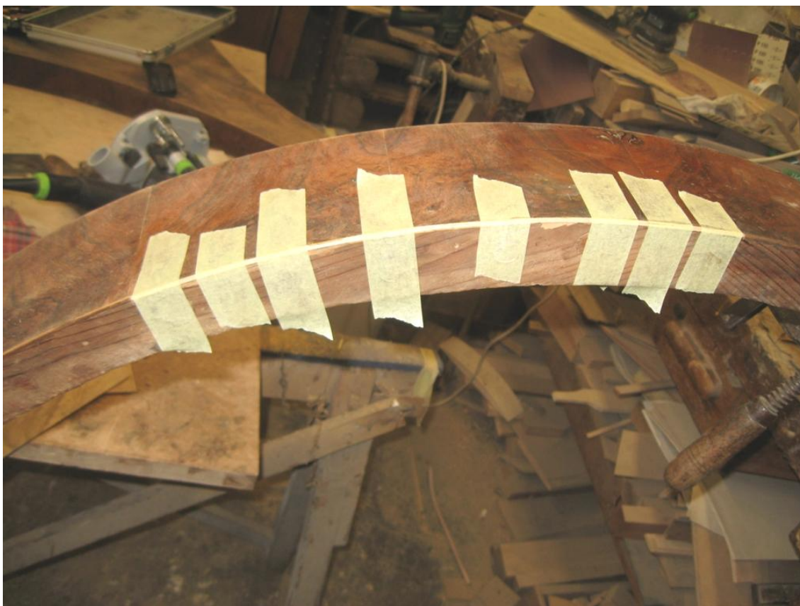
Obr. č. 32: Snímek zachycuje průběh doplňování javorové linky na spodní hraně lubu.