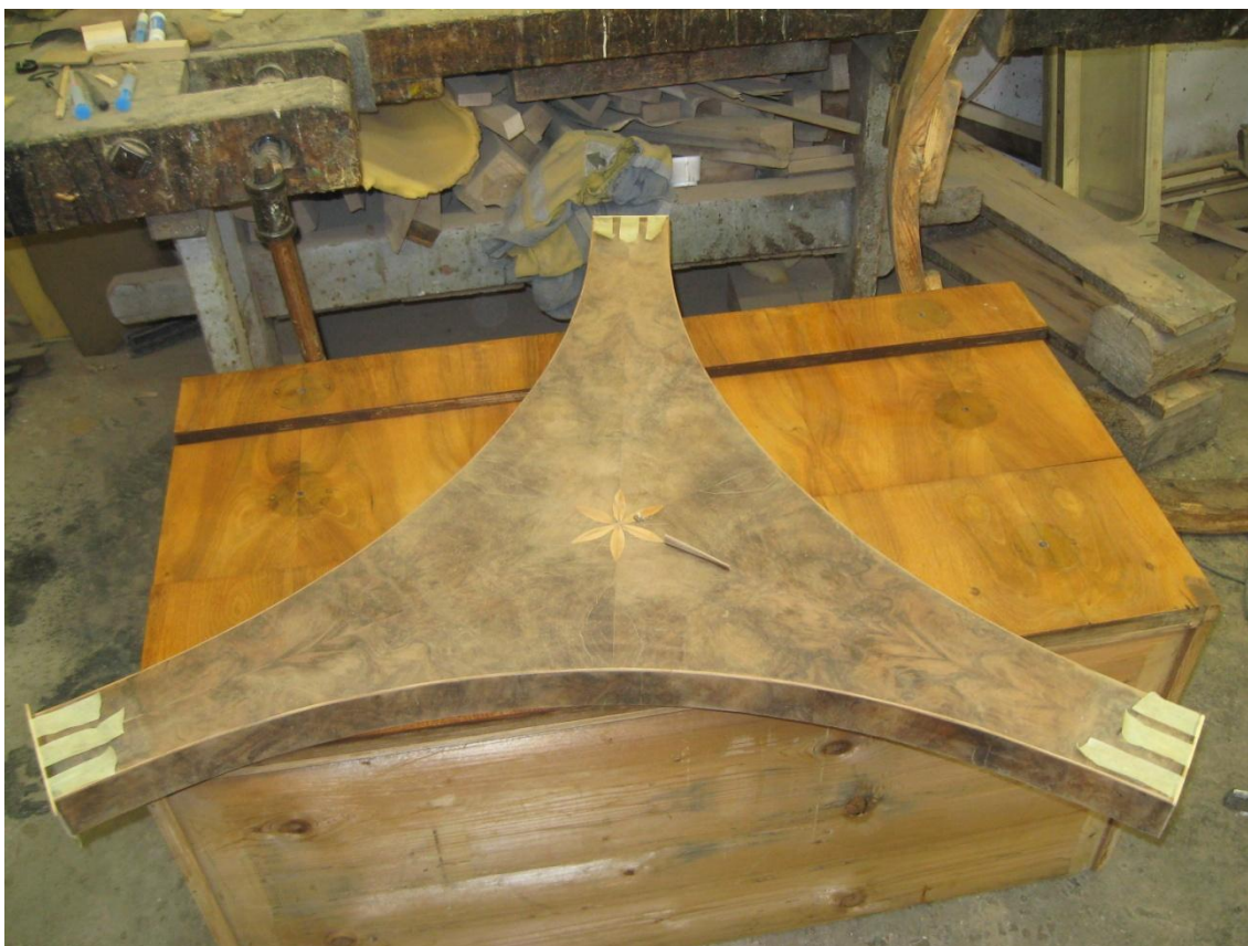
Obr. č. 21: Snímek zachycuje spodní soklovou část po podlepení a zabroušení. Na snímku je zachyceno lepení javorové linky na hraně.