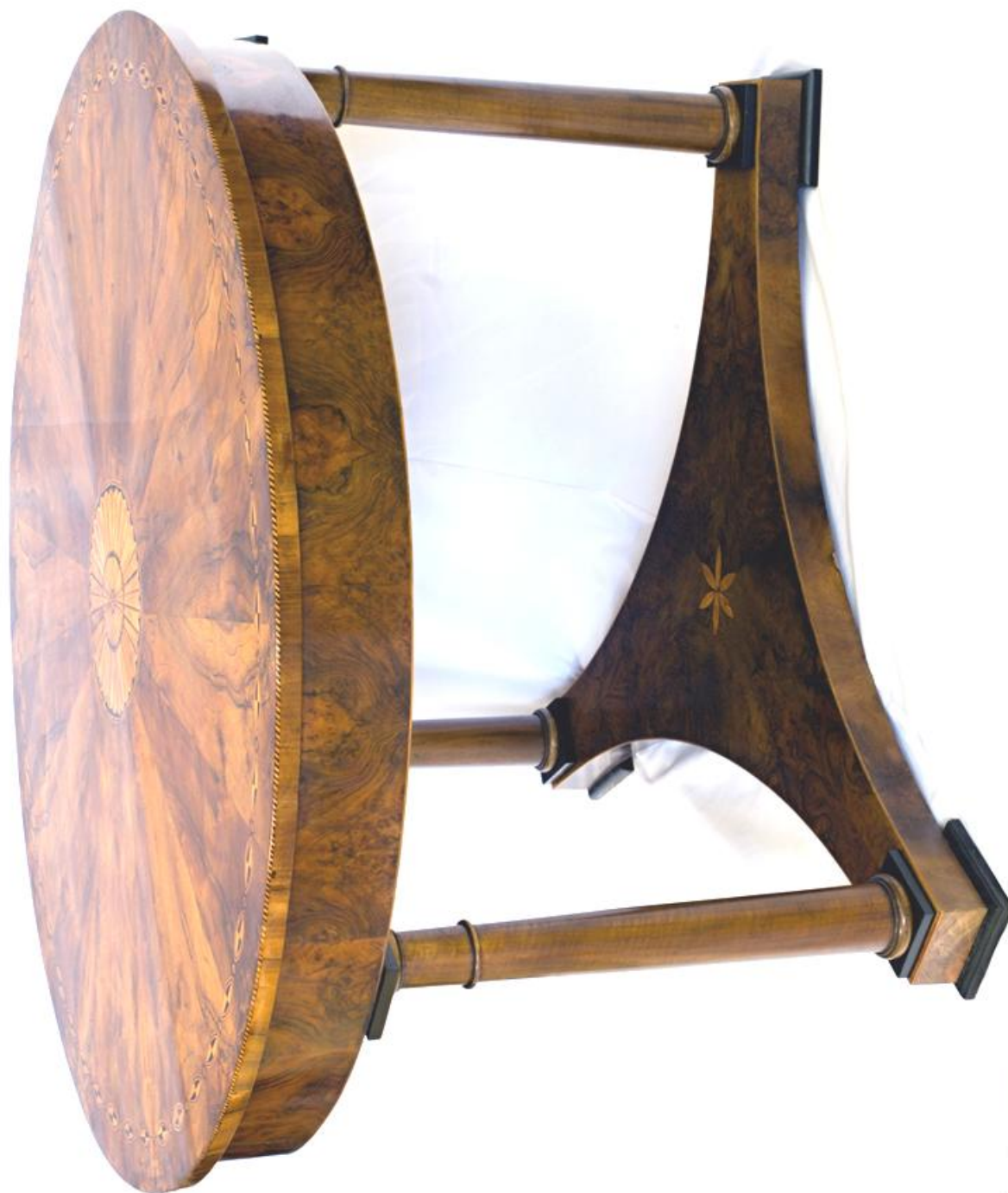
Obr. č. 33: Celkový pohled na stůl – stav po restaurování